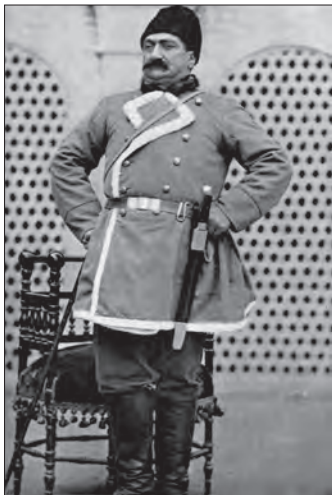
مسعود میرزا ظل السلطان (۱۲۲۸-۱۲۹۷ش)، پسر ناصرالدین شاه ۳۴ سال متوالی حاکم اصفهان و حدود ۴۵ سال متناوب حاکم مازندران، اصفهان و فارس بود.

والیان و حاکمان ایالات و ولایات، شهرها و روستاها عمدتاً از میان خاندان‌های زمین‌دار، اعیان یا بزرگان محلی، سران ایلات و عشایر و شاهزادگان قاجاری برگزیده می‌شدند. حاکمان ایالات و ولایات تا حدودی خودمختار بودند و بخش اعظم درآمد منطقه تحت فرمان خویش را برای خود نگه می‌داشتند. شاهان قاجار از طریق برقراری پیوند ازدواج با خاندان‌های زمین‌دار، بزرگان محلی و مقام‌های بلند پایهٔ حکومتی به دنبال گسترش نفوذ و استحکام سلطنت خود بودند. ادارهٔ ایالت آذربایجان با مرکزیت شهر تبریز، همواره