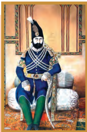
نگاره محمدشاه (۱۲۲۳-۱۲۶۴ق)

پس از مرگ آقامحمدخان، برادرزاده‌اش باباخان که به فتحعلی‌شاه معروف شد، زمام امور را به دست گرفت. سال‌های نخست سلطنت فتحعلی‌شاه به سرکوب شورش‌های داخلی و تحکیم پادشاهی در خاندان قاجار گذشت. در دوران سلطنت نسبتاً طولانی او، حکومت قاجار از یک سو با تهاجم نظامی