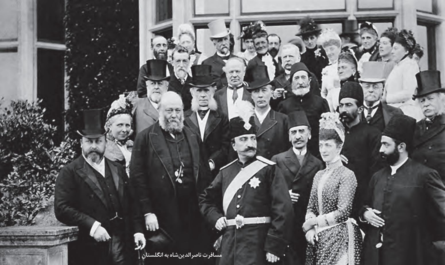
مسافرت ناصرالدین شاه به انگلستان

ناصرالدین شاه شور و اشتیاق فراوانی به نوگرایی و اخذ تمدن اروپایی نشان می‌داد. او در دوران پادشاهی خود طی سه مسافرت خارجی، از چندین کشور اروپایی دیدن کرد و تحت تأثیر پیشرفت‌های علمی و صنعتی اروپاییان قرار گرفت. میرزا حسین خان سپهسالار، یکی از صدراعظم‌های عصر ناصری، نقش مؤثری در تشویق شاه برای سفر به فرنگ ۱ و اخذ تمدن اروپایی داشت. این صدراعظم نوگرا و ترقی خواه مصمم به اصلاح تشکیلات سیاسی و اداری کشور و جلب سرمایه‌گذاری خارجی در ایران بود اما برنامه‌های او به سبب مخالفت‌های داخلی و تردیدهای شاه به جایی نرسید. ناصرالدین شاه اگرچه ضرورت نوگرایی و جبران عقب‌ماندگی کشور را درک کرده بود، از نتایج سیاسی آن، که کاهش قدرت و اختیارات نامحدود شاه بود، به شدت وحشت داشت. برای مثال، او مدرسه دارالفنون را نماد ترقی قلمداد می‌کرد و علاقه فراوانی به انتشار کتاب و روزنامه داشت اما در عین حال، از نشر اندیشه سیاسی جدید و ترویج افکار مشروطه‌طلبی و جمهوری‌خواهی در ایران سخت بیمناک بود. از این رو، اصلاحات عهد او به تغییر اساسی منجر نشد.