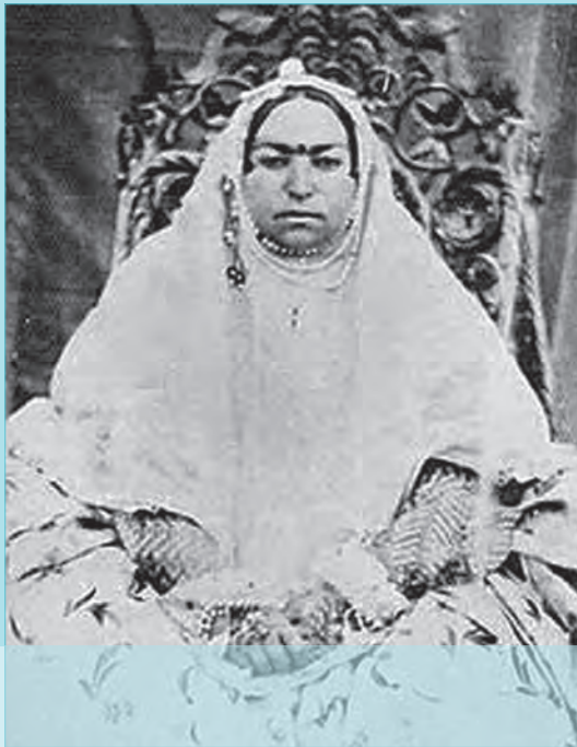
ملک نساء خانم عزت الدوله، خواهر ناصرالدین شاه و همسر امیر کبیر