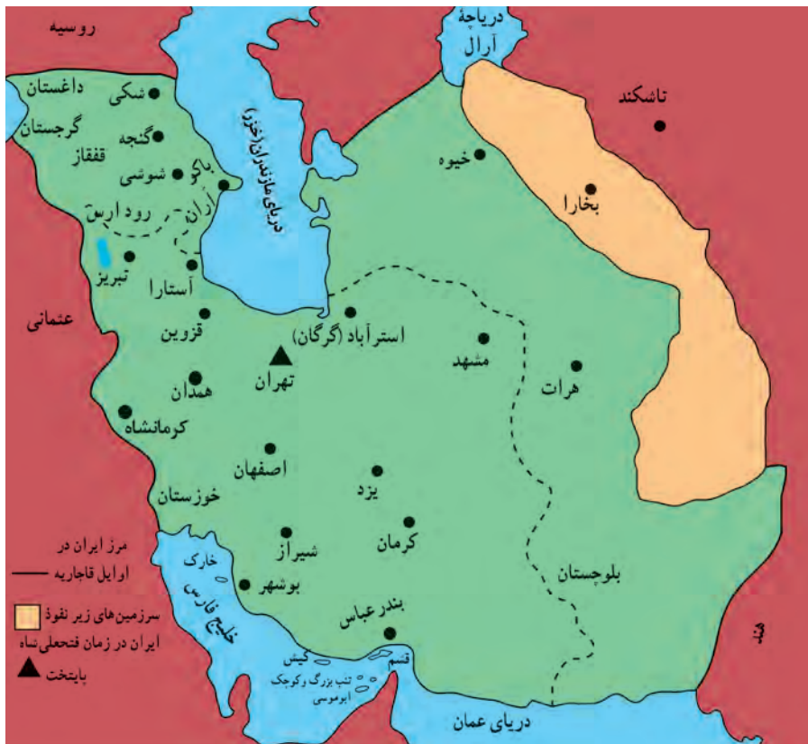
قلمرو حکومت قاجار در زمان فتحعلی شاه