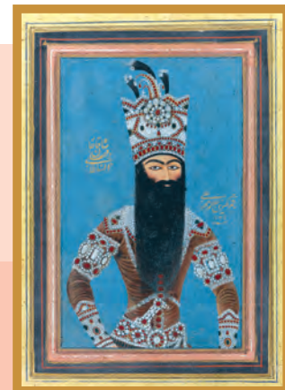
نگاره فتحعلی‌شاه (۱۱۸۶-۱۲۵۰ق) - اثر مهرعلی نقاش