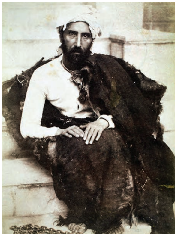
میرزا رضا کرمانی (۱۲۲۶-۱۲۷۵ ش)

با راهنمایی دبیر، بخشی از سفرنامه‌های ناصرالدین‌شاه به فرنگستان را انتخاب و گزارشی از خاطرات و بازدیدهای او در یک صفحه تهیه کنید.