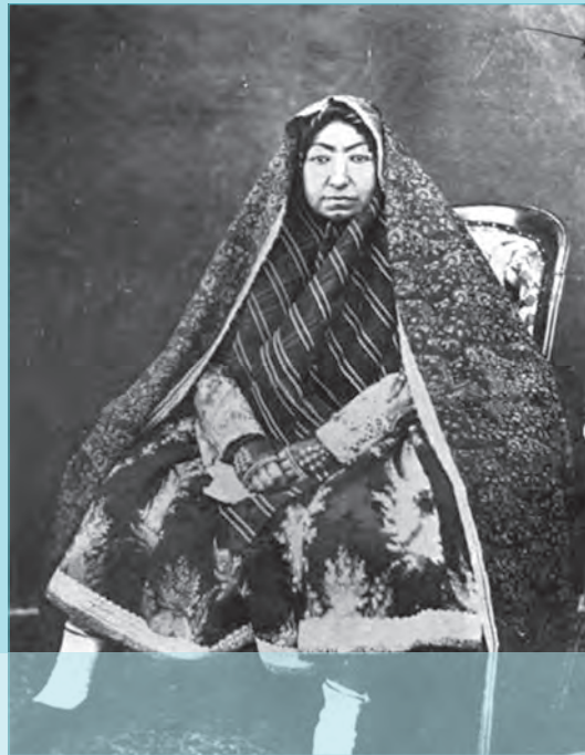
مهدعلیا (۱۲۲۰-۱۲۹۰ق)، مادر ناصرالدین شاه، از زنان بانفوذ دربار قاجار