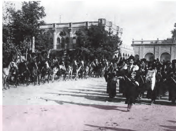
رژه نیروهای قزاق