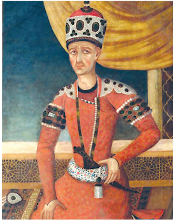
نگاره آقا محمدخان قاجار (۱۱۵۵-۱۲۱۱ق)

خود قرار داد، سپس با غلبه بر لطفعلی خان زند و سرکوب طغیان حاکم گرجستان، در سال ۱۲۱۰ق/۱۷۴۰ش در تهران تاج گذاری کرد.