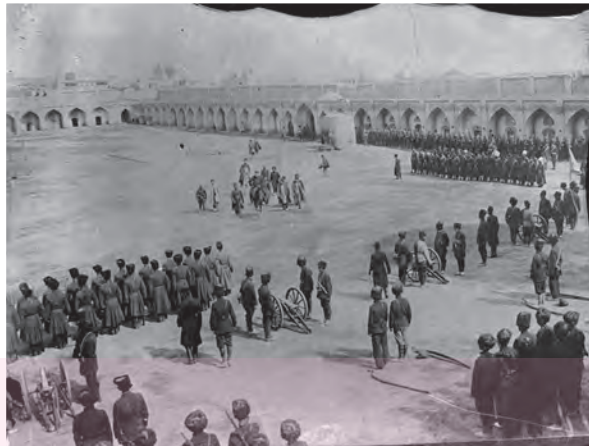
رژه واحدهای نظامی در میدان مشق - تهران

کارشناسان نظامی فرانسه و انگلستان، ارتش ایران را تجدید سازمان و مجهز به سلاح‌های مدرن کند، اما تلاش‌های او به دلیل پیمان‌شکنی دولت فرانسه، بدعهدی دولت انگلیس و موانع و مشکلات داخلی بی‌نتیجه ماند. در اوایل عصر ناصری، امیرکبیر، صدراعظم باکفایت ایران، با جدیت تمام برای تشکیل ارتش حرفه‌ای و دائم اقداماتی انجام داد. یکی از مقاصد او از تأسیس مدرسه دارالفنون، آموختن دانش نظامی جدید و اشاعه آن و نیز تقویت توان جنگی و دفاعی کشور بود. پس از امیرکبیر، این اقدام نوگرایانه او همچون سایر اقداماتش به فراموشی سپرده شد، تا اینکه ناصرالدین‌شاه امتیاز تأسیس یک واحد نظامی حرفه‌ای با عنوان بریگاد قزاق را به روسیه واگذار کرد. نیروی قزاق تشکیلات نظامی منسجم و منظمی بود که تا اواخر حکومت قاجار تحت فرماندهی افسران روسی فعالیت می‌کرد. نفرت این نیرو در اوج گسترش کمتر از ۱۰ هزار نفر بود و بیشتر به عنوان نیروی نگهبان شخص شاه و خاندان سلطنت و دفع‌کننده شورش‌ها و اعتراض‌های داخلی عمل می‌کرد و در حفظ مرزها و مقابله با هجوم خارجی کارایی چندانی نداشت.