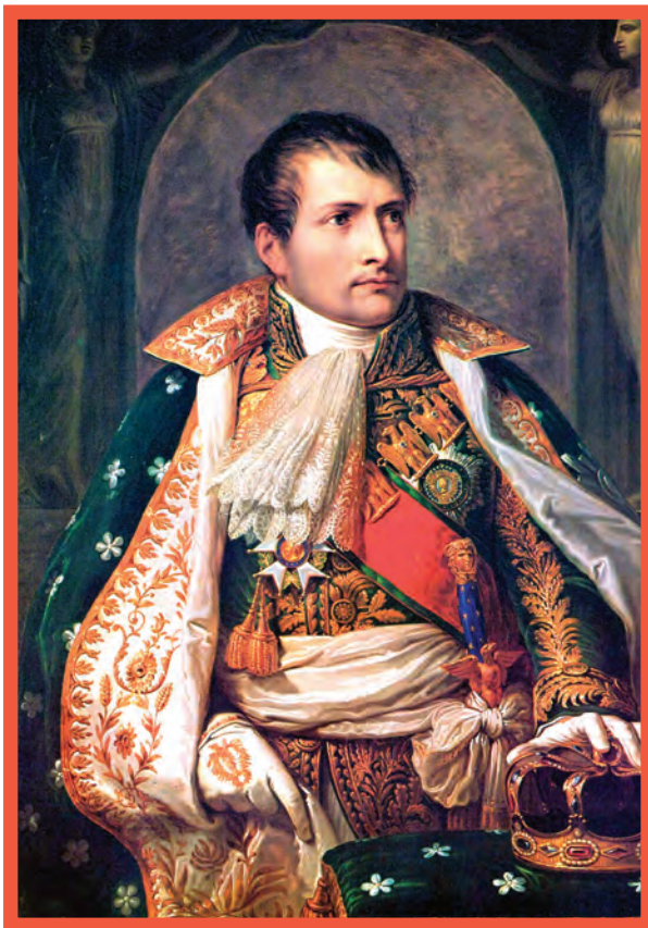
ناپلئون بناپارت، امپراتور فرانسه

هم‌زمان با روی کار آمدن قاجارها در ایران، ناپلئون بناپارت در فرانسه قدرت گرفت. ناپلئون که سیاست توسعه‌طلبانه‌ای را در اروپا و جهان دنبال می‌کرد، با مانع بزرگی همچون انگلستان روبه‌رو شد که به دلیل جزیره‌ای بودن و برخورداری از نیروی دریایی قدرتمند، توان رویارویی مستقیم با آن را نداشت. بنابراین، تصمیم گرفت رقیب خود را با هجوم به مستعمراتش از پای درآورد.