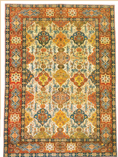
قالیچه بافته شده در آذربایجان - دوره قاجار