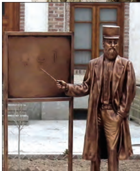
تندیس میرزا حسن رشديه

میرزا حسن رشديه یکی از شخصیت‌های فرهنگی عصر قاجار بود که برای تأسیس مدرسه‌های جدید به ویژه در دوره تحصیلی ابتدایی در شهرهای مختلف ایران بسیار تلاش کرد و در این راه رنج‌ها و سختی‌های فراوانی کشید. هدف رشديه از برپایی مراکز آموزشی جدید، فراهم آوردن شرایط برای سوادآموزی به فرزندان تمام قشرهای مختلف جامعه بود. در دوره قاجار، برخی از زنان فاضل نیز در تأسیس مدارس جدید مشارکت داشتند. از جمله این زنان می‌توان به بی بی خانم استرآبادی اشاره کرد که مدرسه دوشیزگان را به منظور تحصیل دختران در تهران تأسیس کرد (۱۲۸۵ ش).