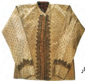
نمونه‌ای از لباس‌های دوره قاجار