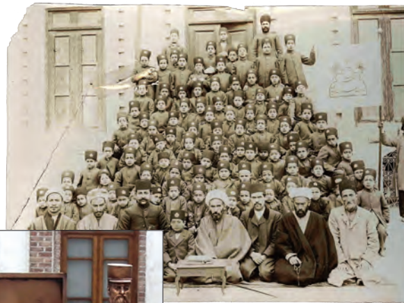
معلمان و دانش آموزان مدرسه رشديه تهران

به نظر شما چرا امیر کبیر دستور داد، استادان و معلمان مدرسه دارالفنون از کشورهای غیر از روسیه و انگلستان (مانند فرانسه و اتریش) استخدام شوند؟