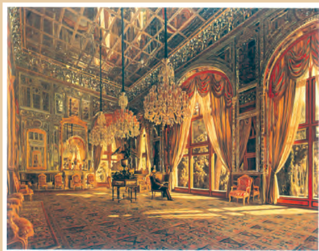
تابلوی تالار آینه اثر کمال‌الملک، نقاش عصر قاجار و پهلوی

در دوره ناصرالدین‌شاه، سنت نگارگری ایرانی تحت تأثیر هنر نقاشی مدرن اروپایی قرار گرفت. سبک نوینی در نقاشی به وجود آمد و نقاشان بزرگی مانند محمد غفاری معروف به کمال‌الملک، پا به عرصه نهادند.