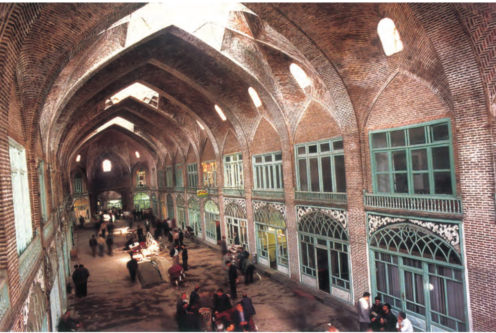
تیمچه مظفریه - تبریز

در رأس ایلات سران ایل قرار داشتند و تمام مناسبات و روابط حکومت و ایل زیر نظر آنها انجام می‌گرفت. افراد ایل به سبب کارهایی که برای رهبران خود انجام می‌دادند، نسبت به روستاییان وضعیت بهتری داشتند. آنان همواره به عنوان نیروهای مسلح در مواقع جنگ یکی از منابع تأمین نیروی نظامی حکومت قاجار به‌شمار می‌رفتند. سران ایلات اغلب در مناطق