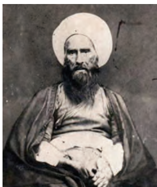
حاج ملاهادی سبزواری

در دوره قاجار تحولی چشمگیر در فلسفه اسلامی به وجود آمد. ملا عبدالله زُنوزی یکی از شاگردان برجسته ملاعلی نوری، مؤسس حوزه فلسفی تهران در این دوره شناخته می‌شود. او دواثر ارزشمند در موضوع فلسفه به زبان فارسی نوشت. نگارش آثار فلسفی به زبان فارسی در دوره صفویه به تدریج از رونق افتاده بود. حوزه فلسفی تهران را فیلسوفان برجسته دیگری گسترش دادند و موجب رشد و توسعه فلسفه اسلامی و شاخه‌های گوناگون آن مثل مکتب مشاء، حکمت اشراق و حکمت متعالیه صدرایی و عرفانی شدند.