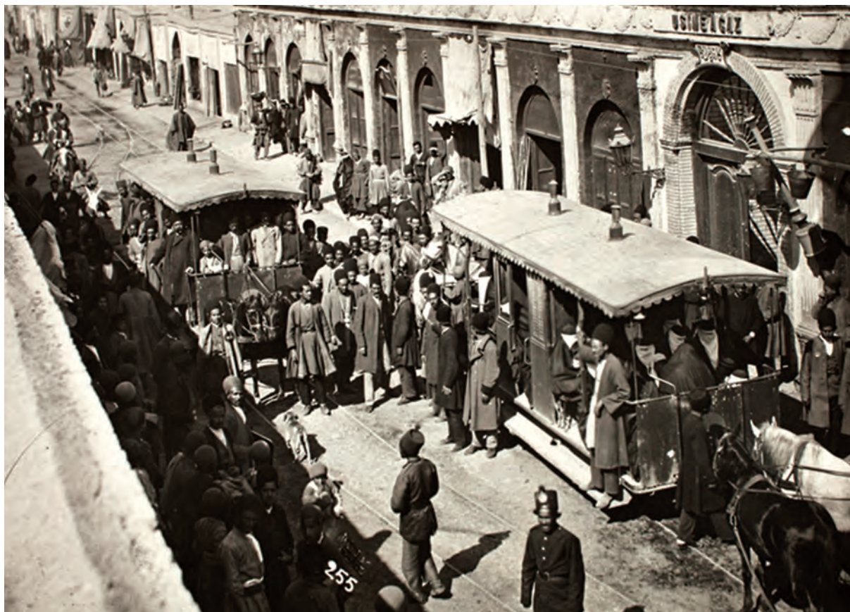
خیابان چراغ گاز (امیرکبیر کنونی) تهران - دوره قاجار

آشنایی با اوضاع اجتماعی، تحولات اقتصادی و جنبه‌های مختلف حیات علمی و فرهنگی ایران دوره قاجار نظیر هنر و معماری، از مباحث مهم و کلیدی در مطالعات تاریخی این دوره محسوب می‌شود. شما در این درس با استفاده از شواهد و مدارک تاریخی، برخی از وجوه زندگی اجتماعی، اقتصادی و فرهنگی عصر قاجار را بررسی و تحلیل خواهید کرد.