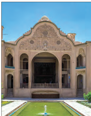
خانه بروجردی‌ها - کاشان

سنت معماری ایرانی اسلامی که در دوران سلجوقی، تیموری و صفویان درخشش بی‌نظیری داشت، در عصر قاجار با توجه به شرایط اقلیمی و آب و هوایی و نوع مصالح ساختمانی تداوم یافت. پس از اختراع دوربین عکاسی، مسافرانی که در عصر ناصری به اروپا می‌رفتند، تصاویر زیادی از بناهای آن سرزمین با خود به ایران آوردند. بسیاری از معماران به سفارش دربار و ثروتمندان با استفاده از برخی از عناصر معماری فرنگی و تلفیق آن با معماری ایرانی، سبکی از معماری را به وجود آوردند که در آن عناصر و ویژگی‌های معماری ایرانی و اروپایی ترکیب شده بود. این بناها که به بناهای «کارت پستالی» معروف شد، بیشتر به تقلید از بناهای اروپایی ساخته می‌شدند. یکی از این بناهای معروف، کاخ شمس‌العماره واقع در مجموعه کاخ گلستان است که به دستور