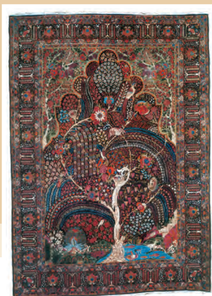
قالیچه کرمان - دوره قاجار

در این مراکز آموزشی، علوم نقلی و عقلی تعلیم داده می‌شد. مدرسه‌های مروی و سپهسالار (مدرسه عالی شهید مطهری کنونی) از جمله مراکز علمی و آموزشی مهم و بزرگ این دوره بودند که در پایتخت تأسیس شدند. عالمان و اندیشمندان برجسته‌ای در این مراکز تحصیل و تدریس می‌کردند.