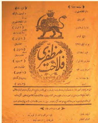
روزنامه فلاح مظفری

متن زیر را بخوانید و به پرسش‌های مربوط به آن پاسخ دهید.