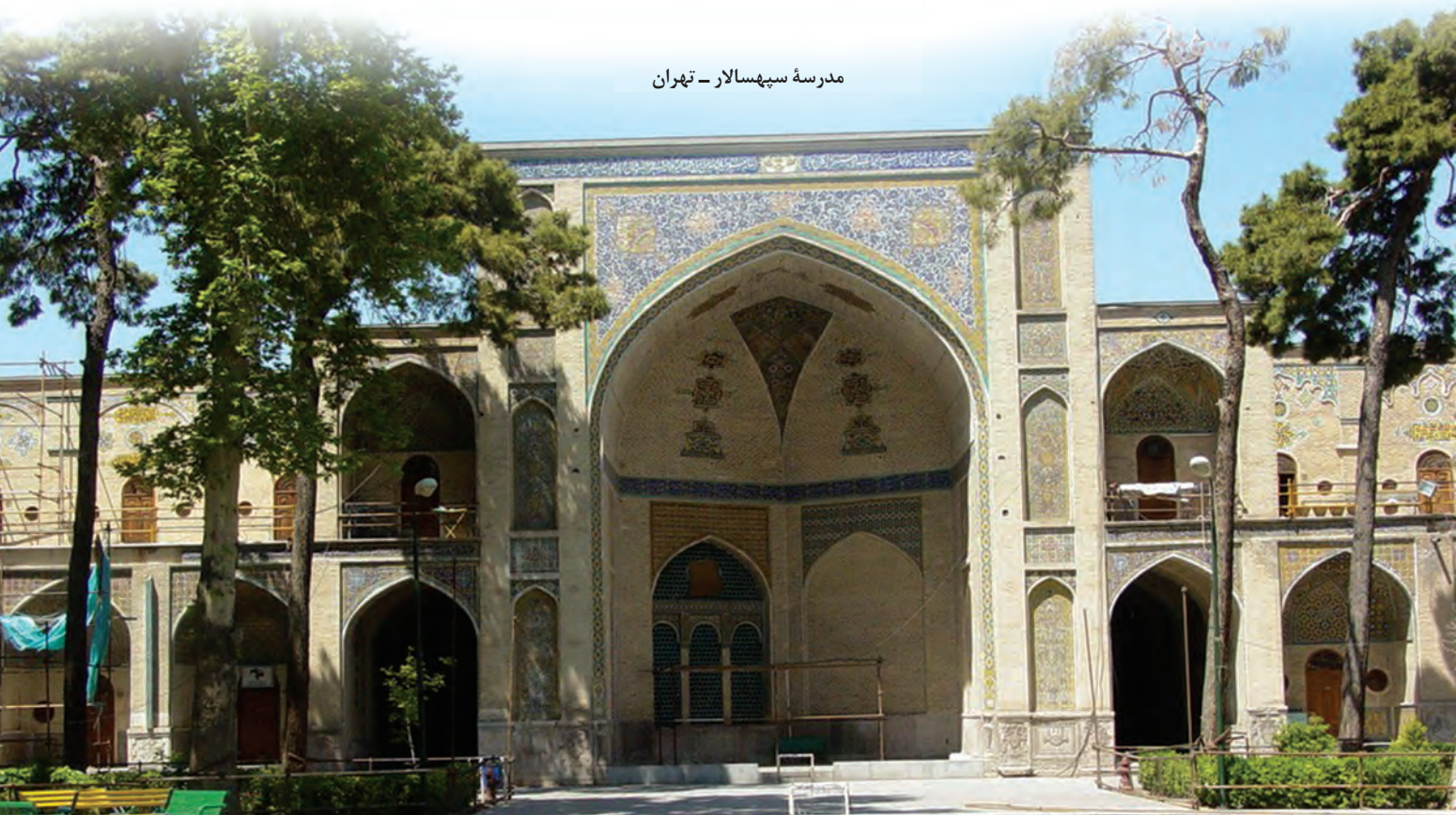
مدرسه سپهسالار - تهران

در دوره قاجار نیز نظام تعلیم و تربیت سنتی ایران تداوم و گسترش یافت. در آن زمان سوادآموزی مقدماتی در مکتب‌خانه‌ها یا از طریق معلمان خصوصی و یا معلمان سرخانه انجام می‌گرفت. دانش‌آموزانی که توانایی مالی و علاقه به ادامه تحصیل داشتند، وارد مدرسه‌های قدیم و حوزه‌های علمیه می‌شدند.