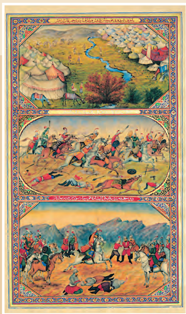
سه پرده از نقاشی‌های هزار و یک شب اثر ابوالحسن غفاری (صنیع‌الملک)، نقاش باشی ناصرالدین‌شاه

در دوره ناصرالدین‌شاه، سنت نگارگری ایرانی تحت تأثیر هنر نقاشی مدرن اروپایی قرار گرفت. سبک نوینی در نقاشی به وجود آمد و نقاشان بزرگی مانند محمد غفاری معروف به کمال‌الملک، پا به عرصه نهادند.