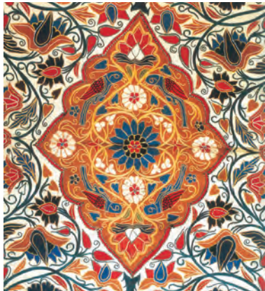
نمونه‌ای از پارچه‌های دوره قاجار

از لحاظ کیفیت و دوام در وضعیت مطلوبی بودند. با پایان یافتن جنگ در اروپا و سرازیر شدن سیل کالاهای اروپایی، صنایع دستی ایران به تدریج رو به انحطاط رفت. بسیاری از اروپاییان که در این زمان از ایران دیدن کرده‌اند، از نابودی و ضعف مراکز قدیمی و پررونق صنایع دستی ایران مثل کاشان، اصفهان، شیراز، کرمان و یزد خبر داده‌اند. کالاهای اروپایی، به ویژه محصولات صنعتی انگلستان، صدمه شدیدی به صنایع ایران وارد آورد. در دوره صدارت امیرکبیر تلاش‌های زیادی برای احیای صنایع دستی ایران صورت گرفت اما با مرگ او این تلاش‌ها پیگیری نشد.