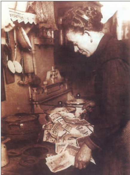
در سال ۱۹۲۳، ارزش مارک آلمان به اندازه‌ای سقوط کرد که از اسکناس به جای سوخت، به عنوان کاغذ دیواری و برای پر کردن تشک استفاده می‌شد.

یکی از مسائل مهم جهان و به خصوص اروپا در دوران پس از جنگ جهانی اول، بازسازی ویرانی‌های ناشی از جنگ و ایجاد رونق و رفاه اقتصادی بود. برخی از کشورها، مانند انگلستان، به اتکای منابع خود و ثروت مستعمراتشان تا حدودی از عهده‌این کار برآمدند اما بسیاری دیگر با مشکلات شدیدی مانند رکود و تورم روبه‌رو شدند. آلمان از جمله کشورهایی بود که در نخستین سال‌های پس از جنگ جهانی اول شرایط اقتصادی وخیمی داشت؛ زیرا علاوه بر خرابی‌های حاصل از جنگ، مستعمراتش را از دست داده و محکوم به پرداخت غرامت‌های سنگین شده بود.