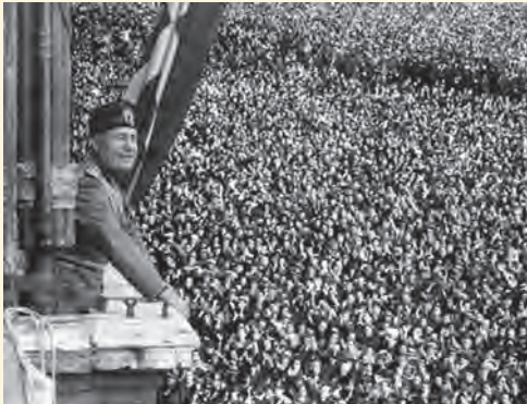
موسولینی هنگام سخنرانی در میان هواداران پرشور خود- وینز ۱۹۳۳ م

یکی از رایج‌ترین شیوه‌های تبلیغات فاشیستی طرح شعارهایی چون «موسولینی همواره درست می‌گوید» به صورت پوستر و چسباندن آن بر در و دیوار در سرتاسر ایتالیا بود (فوگل، تمدن مغرب زمین، ج ۲، ص ۱۲۰۵). در باره نسبت این شعار با مرام و مسلک فاشیستی با یکدیگر مباحثه کنید.