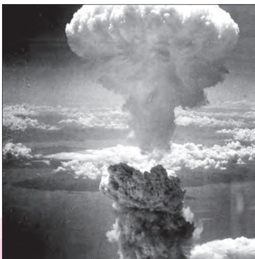
بمباران اتمی ژاپن توسط آمریکا

پس از به زانو درآمدن نازی‌ها، جنگ با ژاپن ادامه یافت. در حالی که نشانه‌های شکست و تسلیم شدن ژاپنی‌ها آشکار شده بود، هواپیماهای آمریکایی دو شهر هیروشیما و ناگاساکی ژاپن را با بمب‌های اتمی ویران کردند و جنگ جهانی دوم با این حادثه وحشتناک به پایان رسید (اوت ۱۹۴۵).