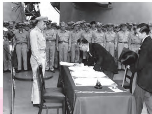
وزیر خارجه ژاپن در حال امضای تسلیم‌نامه این کشور - سپتامبر ۱۹۴۵