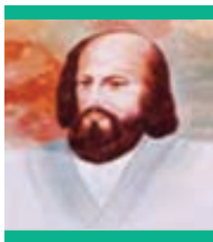
ابوحامد محمد غزالی

ابوحامد محمد معروف به امام محمد غزالی یکی از بزرگ ترین متکلمین اشعری است. وی پرچمدار مخالفت با فلسفه مشائی بود. غزالی در فلسفه استادی نداشت و این علم را نزد کسی نیاموخته بود. او در مدت سه سالی که در مدرسه نظامیه بغداد به تدریس اشتغال داشت، به برکت هوش سرشار خویش به مطالعه کتب فلسفی پرداخت و توانست از عقاید فلاسفه آگاهی یابد. غزالی