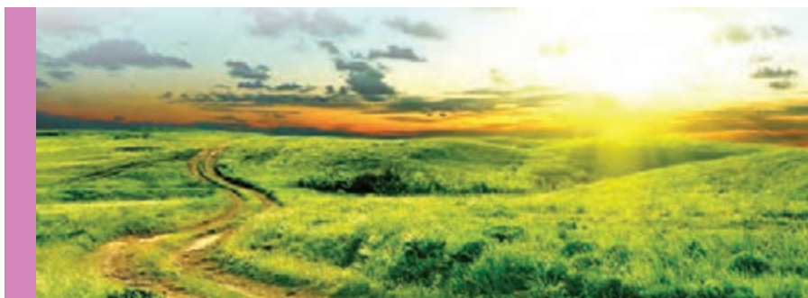
۱. سوره فاطر/ آیه ۴۱.

۲. در نتیجه اعتقاد فوق، انسان خداشناس می‌داند که زندگی در جهانی قانونمند که پشتوانه آن علم و قدرت خداست، به وی امکان حرکت و فعالیت می‌دهد. زیرا او می‌تواند قوانین حاکم بر جهان خلقت را بشناسد و برای رفع نیازهای خود از قوانین استفاده کند و به هدف‌های خود برسد. به عبارت دیگر، او در جهانی زندگی می‌کند که «قضا و قدر الهی» بر آن حاکم است.