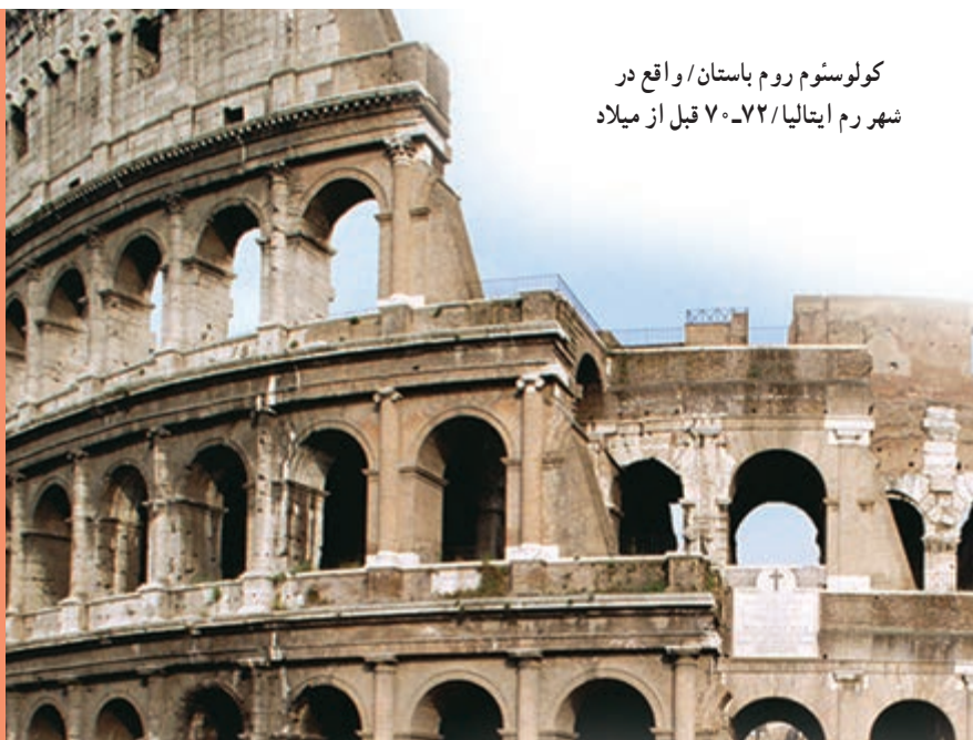
کولوسئوم روم باستان / واقع در شهر رم ایتالیا / ۷۲-۷۰ قبل از میلاد

«پیش از شما، سنت‌هایی وجود داشت (و هر قوم، طبق اعمال و صفات خود، سرنوشت‌هایی داشتند که شما نیز، همانند آن را دارید). پس در روی زمین گردش کنید و ببینید سرانجام تکذیب‌کنندگان (آیات خدا) چگونه بوده است؟!»