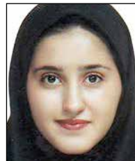
فروش فخار رتبه چهارم کاشان