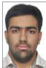
رتبه چهارم سپهر اسلامی تهران