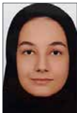
رتبه اول گروه آزمایشی هنر روژینا آزادی تهران