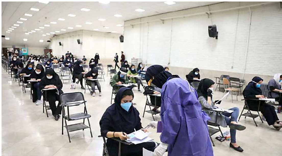
از سوی رئیس سازمان سنجش تشریح شد