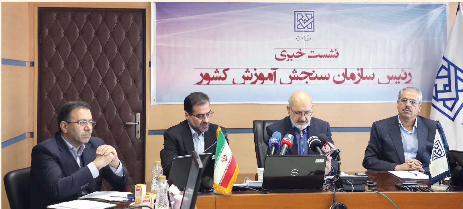
رئیس سازمان سنجش آموزش کشور اعلام کرد