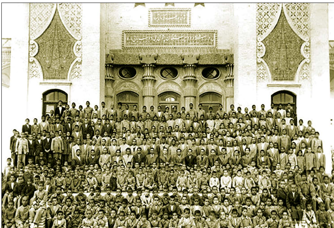
نخستین مرکز آموزشی نوین در ایران، دانشسرای عالی (دارالمعلمین قبلی و تربیت معلم بعدی و خوارزمی کنونی)

علاوه بر رتبه‌بندی دانشگاه‌ها در سطح جهانی، در داخل کشور نیز رتبه‌بندی علمی دانشگاه‌ها صورت می‌گیرد و متولی آن، سازمان آی اس سی (ISC) ۳ است که به رتبه‌بندی دانشگاه‌ها و مؤسسات پژوهشی ایران می‌پردازد. طبق ارزیابی انجام شده این مؤسسه، جایگاه دانشگاه‌های برتر کشور بین ۱۰۰ دانشگاه، در سطوح مختلف، در جدول زیر بیان شده است.