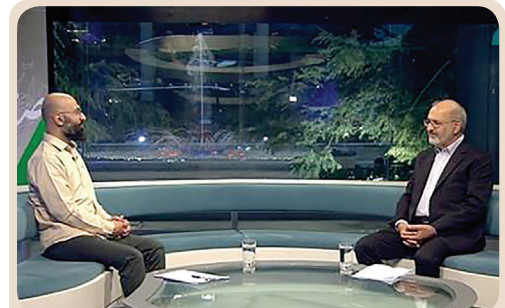
رئیس سازمان سنجش آموزش کشور تشریح کرد: