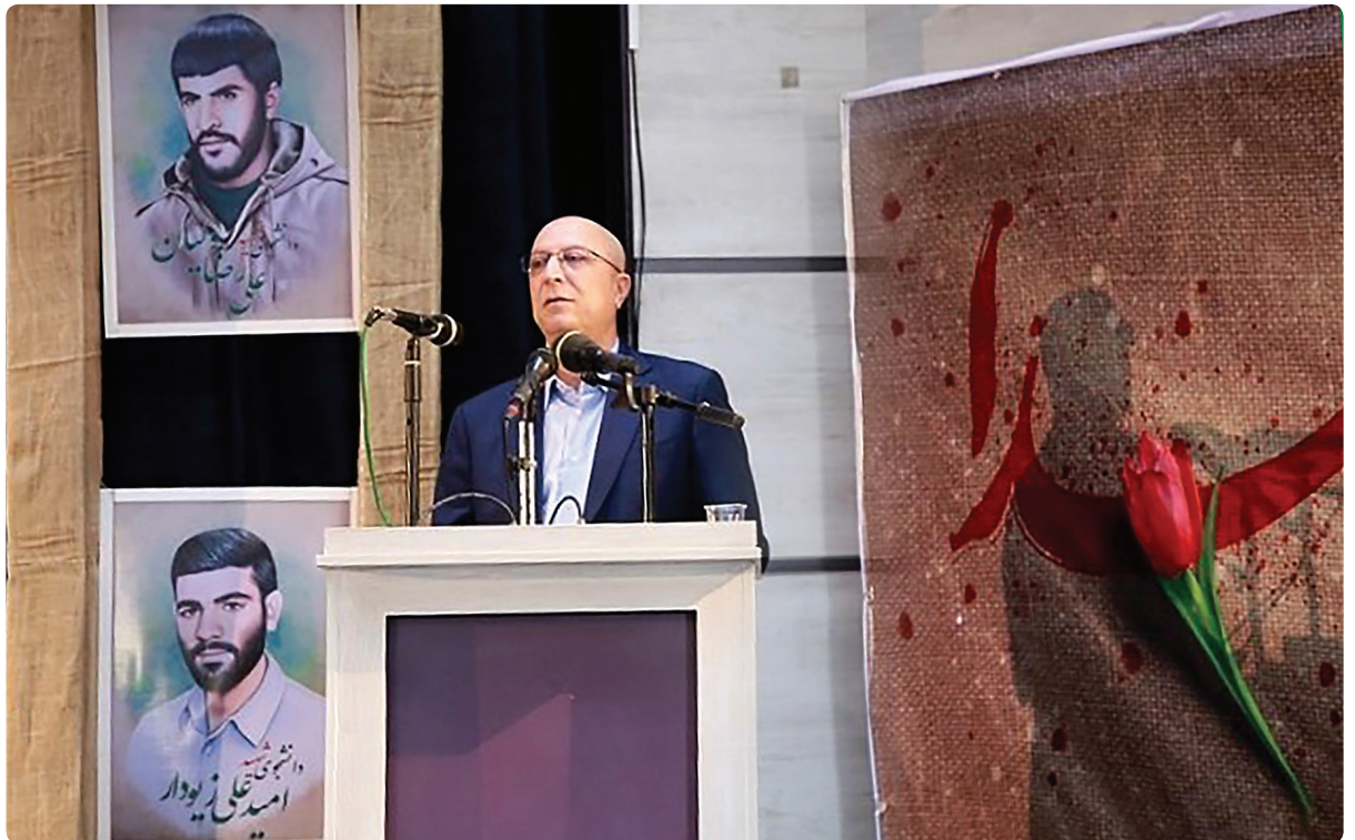
مشاور رئیس و مدیرکل روابط عمومی سازمان سنجش خبر داد