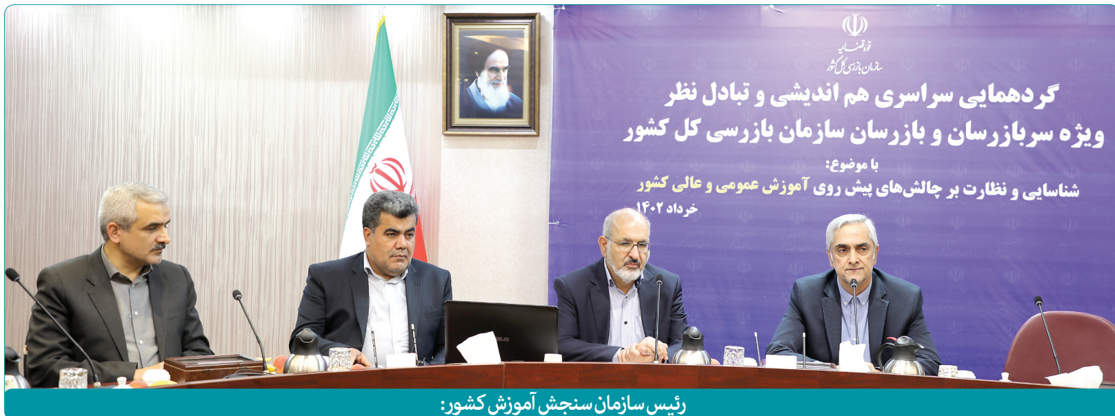
رئیس سازمان سنجش آموزش کشور:

هفته‌نامه خبری و اطلاع‌رسانی سازمان سنجش آموزش کشور • دوشنبه ۲۹ خرداد ۱۴۰۲ • ۱۲ صفحه • شماره پیاپی ۱۳۳۰