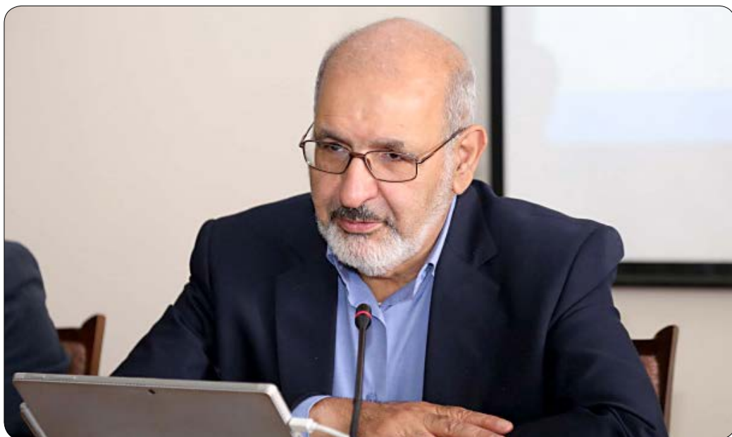
رئیس شورای حفاظت آزمون سراسری گفت: