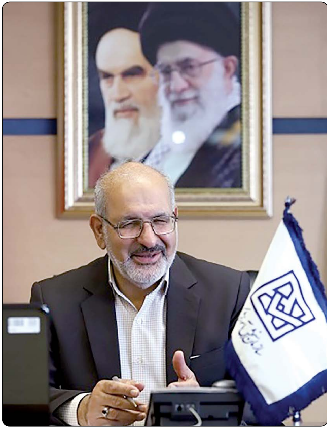
رئیس سازمان سنجش خبر داد

هفته‌نامه خبری و اطلاع‌رسانی سازمان سنجش آموزش کشور • دوشنبه ۲۳ مرداد ۱۴۰۲ • ۲۰ صفحه • شماره پیاپی ۱۳۳۸