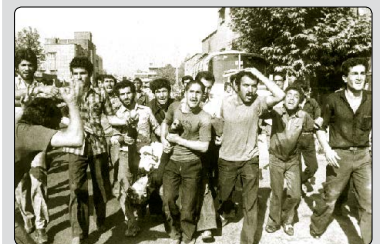
سالروز قیام خونین ۱۷ شهریورماه و یاد و خاطره شهیدان این روز تاریخ ساز، گرامی باد

بر تمام سوگواران واقعه عظیم عاشورا تسلیت باد