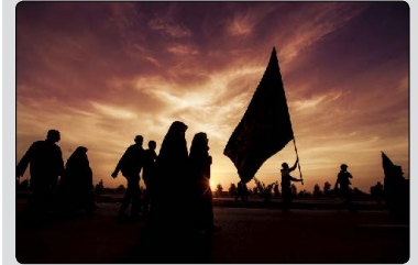
۲۰ صفر، سالروز اربعین حضرت اباعبدالله الحسین (ع)

در مورد برنامه ریزی درسی داوطلبان آزمون ها، چه در این ستون و چه در قالب مقالاتی که در شماره های مختلف این نشریه تاکنون منتشر شده است، با شما بارها سخن گفته ایم و پس از این نیز به فراخور موقعیت های زمانی با شما صحبت خواهیم کرد؛ اما نکته قابل تأمل در این مجال، که شایسته است مد نظر داوطلبان آزمون های مختلف قرار گیرد، آن است که این برنامه ها لازم است اولاً بر مبنای صحیح علمی و تجربیات آموزشی افراد موفق که پیش از این از گردونه آزمون ها عبور کرده و در رشته مطلوب خود در یکی از مقاطع تحصیلی