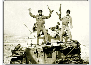
۵ مهرماه، سالروز شکست حصر آبادان در عملیات ثامن الائمه (ع) گرامی باد

آغاز سال تحصیلی جدید، از منظر فردی و اجتماعی، در بردارنده فرصت‌ها و تهدیدهای قابل توجهی است؛ فرصت از این لحاظ که به هر روی، شروع دوره‌ای جدید و گام نهادن در مسیر پیشرفت علمی از سوی دانش‌آموزان و دانشجویان را نوید می‌دهد، و تهدید از آن جهت که اگر برای این پتانسیل با ارزش، که در وجود میلیون‌ها دانش‌آموز و دانشجو جریان دارد، تدبیری اندیشیده نشود و برنامه‌ریزی دقیقی برای هدایت این استعدادها عظیم و شگرف، که سرمایه‌های با ارزش این مردمنده، صورت نگیرد، عملاً پیشرفت قابل توجهی در عرصه‌های علم و فناوری و سایر حوزه‌هایی که با دانش‌اندوزی و علم‌آموزی مرتبطند، حاصل نخواهد شد. در این میان، می‌توان دانش‌آموزان یا دانشجویان را از یک منظر به دو