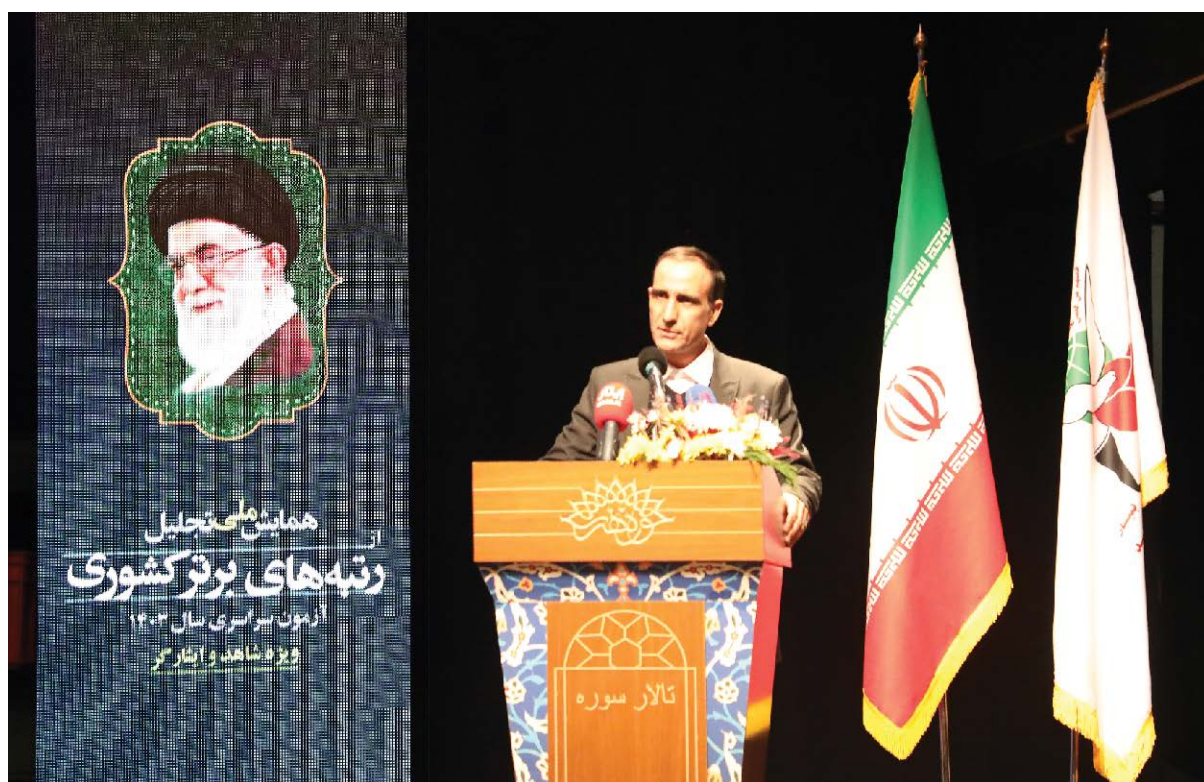
سرپرست سازمان سنجش آموزش کشور خبر داد